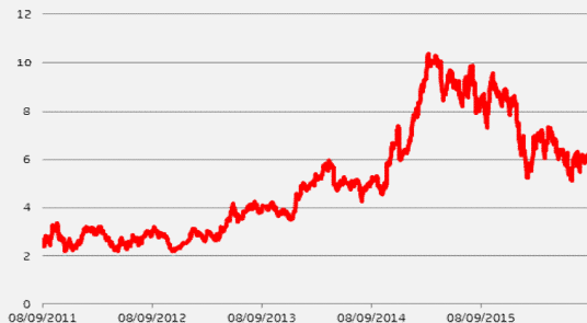
FIAT-FCA: GRAFICO A 5 ANNI

I dati storici non sono necessariamente indicativi delle eventuali performance future dell'azione.