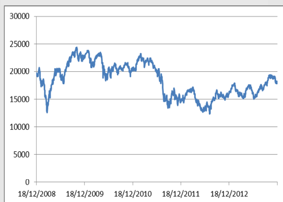
FTSEMIB INDEX: GRAFICO A 5 ANNI

Il FTSE/MIB è attualmente il principale e più significativo indice azionario di Borsa Italiana. L'indice è composto dalle 40 principali società per importanza e liquidità elevata nei diversi settori, e raccoglie circa l'80% della capitalizzazione dell'intero mercato.