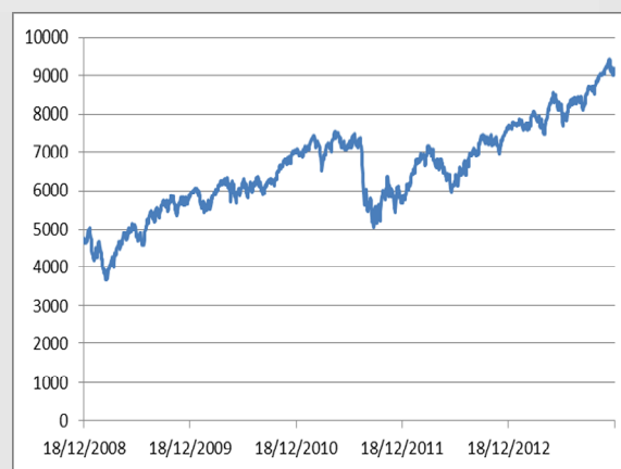
DAX: GRAFICO A 5 ANNI

L'Indice DAX (Deutscher Aktien Index) è il principale indice della Borsa di Francoforte e raccoglie i 30 titoli a maggiore capitalizzazione quotati nel segmento "prime standard". Nasce il 30 dicembre 1987 a quota 1.000 e, dal 2005, viene calcolato ogni secondo da Xetra. L'agente di calcolo è Deutsche Boerse ed il principale mercato dei Futures è Eurex.