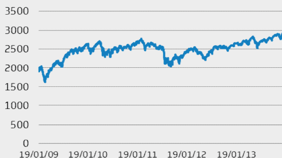
EUROSTOXX 50: GRAFICO A 5 ANNI

L'indice EuroStoxx50 è un indice composto dai 50 titoli azionari a maggior capitalizzazione quotati nelle principali Borse dell'Area Euro. L'indice è stato sviluppato a partire dal 31 Dicembre 1991 con il valore iniziale di 1000. Tale indice comprende, quindi, le migliori 50 società europee, selezionate per solidità patrimoniale e capacità produttiva e ponderate in base al rispettivo flottante e valore di mercato. L'agente di calcolo è Stoxx Ltd ed il principale mercato dei Futures è Eurex.