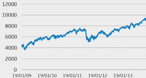
DAX: GRAFICO A 5 ANNI

L'indice EuroStoxx50 è un indice composto dai 50 titoli azionari a maggior capitalizzazione quotati nelle principali Borse dell'Area Euro. L'indice è stato sviluppato a partire dal 31 Dicembre 1991 con il valore iniziale di 1000. Tale indice comprende, quindi, le migliori 50 società europee, selezionate per solidità patrimoniale e capacità produttiva e ponderate in base al rispettivo flottante e valore di mercato. L'agente di calcolo è Stoxx Ltd ed il principale mercato dei Futures è Eurex.