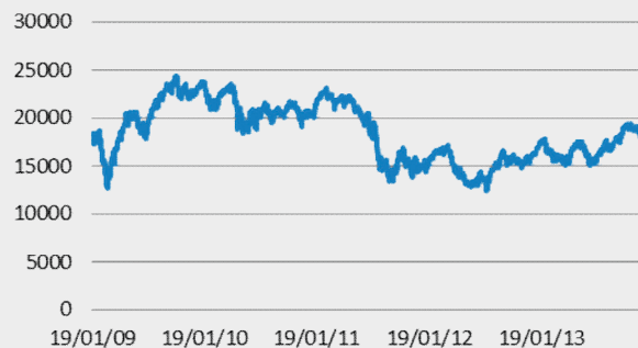
FTSEMIB INDEX: GRAFICO A 5 ANNI

L'indice CAC 40 della Borsa di Parigi è il principale indice della borsa francese, oggi parte di EURONEXT. Il 31 dicembre 1987 è stato fissato il suo valore base a quota 1.000 e comprende le 40 maggiori società, per capitalizzazione, quotate nella borsa francese. L'agente di calcolo è Euronext Indices B.V. ed il principale mercato dei Futures è EURONEXT (MONEP).