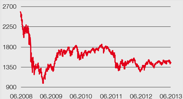
Grafico: fonte Thomson Reuters