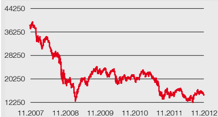
FTSEMIB INDEX: GRAFICO A 5 ANNI

Il FTSEMIB è attualmente il principale e più significativo indice azionario della Borsa Italiana. L'indice è composto dalle 40 principali società per importanza e a liquidità elevata nei diversi settori, e raccoglie circa l'80% della capitalizzazione del mercato interno.